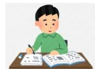
動物愛護センター担当より